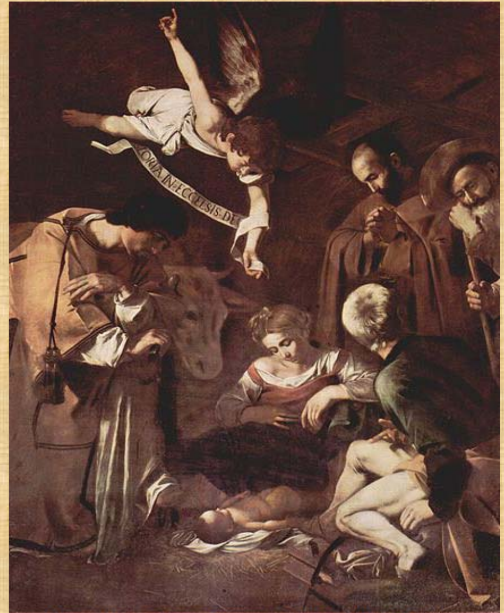
Natività con San Lorenzo e Francesco d'Assisi - 1609 - Palermo

A vent'anni, dopo la morte della madre, niente più lo lega a Milano e, dopo essersi finalmente rifatto di tutti i soprusi e le violenze subite da Peterzano, parte alla volta di Roma. Dopo una lunga serie di rifiuti da parte di vari maestri bottegai e un periodo di stenti e malattie, riesce ad entrare nella bottega di d'Arpino.