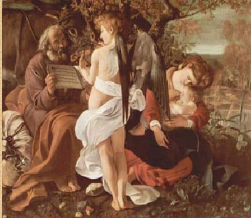
Riposo durante la fuga in Egitto - 1595 - Un Angelo suona il violino e San Giuseppe gli sorregge lo spartito