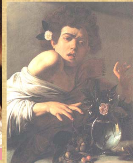
Ragazzo morso dal ramarro 1595 - Roma

La più famosa è l'amore Vincitore, dipinto dai forti toni sensuali. Di contro alcuni opinionisti affermano che è stato un abbaglio che discende da alcune opere che presentano figure effeminate o ritenute provocanti. Del resto ci si è rifiutati di applicare al Caravaggio, sulla base delle bellissime simbologie di cui la sua pittura è intessuta. Nel frattempo inizia anche a crearsi i primi nemici nelle osterie per il suo temperamento esuberante. Nelle sue notti turbolenti rimane folgorato dalla bellezza di Fillide Melandroni, sua modella, provocando una gelosia profonda del suo protettore Ranuccio Tomassoni. Le sue opere iniziano a circolare fra i mercanti e attirano l'attenzione del Cardinale Del Monte, vicino a Costanza Colonna che lo invita a Palazzo Firenze e gli offre la possibilità di dedicarsi senza distrazioni alla sua arte. Nonostante tutto, l'inquietudine di Michele non tardò a prendere il sopravvento. L'amore per Fillide viene immortalato in una serie di capolavori mentre l'astio di Ranuccio gli fanno assaggiare la