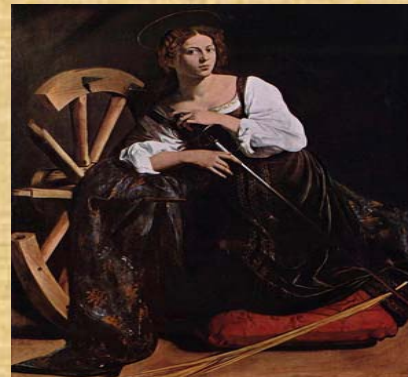
Santa Caterina d'Alessandria - 1598 - Madrid