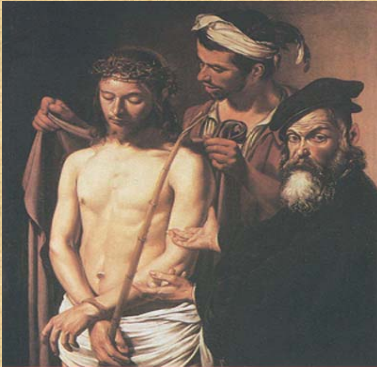
Ecce Homo - 1605 - Genova

Michele è spaventato come non lo è mai stato, braccato dai Cavalieri di Malta, dalle guardie papali e dai vendicativi fratelli di Ranuccio Tomassoni. Intanto a Roma il Cardinale Dal Monte e Costanza Colonna stanno cercando di intercedere presso il Papa per ottenere la grazia. Michele riesce a raggiungere Napoli, dove insieme alla bella notizia della imminente grazia, l'attende anche l'agguato vendicativo dei fratelli Tomassoni, che lo feriscono gravemente. Stavolta le cure di Costanza Colonna sfociano finalmente in