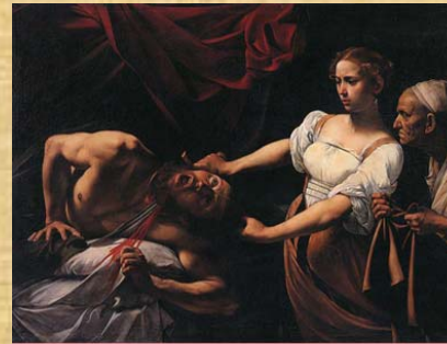
Giuditta e Oloferne - 1599 - Roma

La vera causa della morte del Caravaggio non è stata mai accertata. In pratica potrebbe essere stato un avvelenamento provocato dal piombo e dall'arsenico presenti nei colori e provoca sintomi molto simili a quelli della malaria o del tifo.