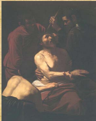
Incoronazione di Spine - 1600 Roma