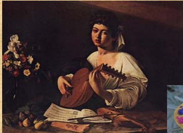
Suonatore di Liuto - 1595 - S. Pietroburgo