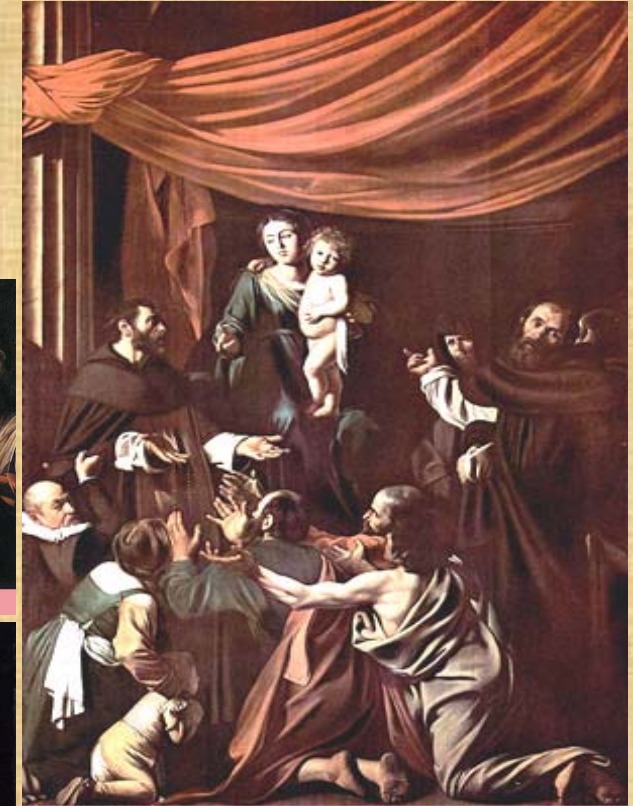
Madonna del Rosario - 1607 - Vienna

Nel dipinto Giuditta e Oloferne, il Caravaggio rappresenta l'episodio Biblico della decapitazione del Re condottiero Assiro da parte della vedova ebraica Giuditta, che voleva salvare il proprio popolo dalla dominazione straniera. Giuditta è raffigurata intenta a mozzare la testa di Oloferne con una spada, mentre alla scena assiste una vecchia serva. Nel ruolo di Giuditta venne raffigurata la cortigiana Fillide Melandroni, amica e modella del grande artista. Nelle sembianze di Santa Caterina d'Alessandria, Caravaggio ha ritratto Fillide Melandroni. L'opera Marta e Maria Maddalena mostra le due amate sorelle della bibbia; Marta è colta nell'atto di convertire Maria dalla sua vita di peccato per condurla alla fede in Cristo.