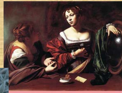
Marta e Maria Maddalena - 1598 - Francia