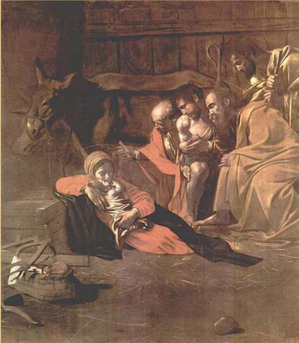
Adorazione dei Pastori - 1609 - Messina

E' qui che nasce la questione dell'omosessualità del Caravaggio che amava molto le pitture di giovani ragazzi seducenti, solitamente intenti a suonare uno strumento (tradizionale accompagnamento all'amore) e mangiare un frutto (simbolo dell'appagamento dei sensi). La continua proposta di questi personaggi ha fatto formulare a molti critici supposizioni riguardo alla presunta omosessualità dell'artista e dei due suoi committenti Il Cardinale Dal Monte e il Marchese Giustiniani che conservano molte di queste opere nei loro gabinetti privati.