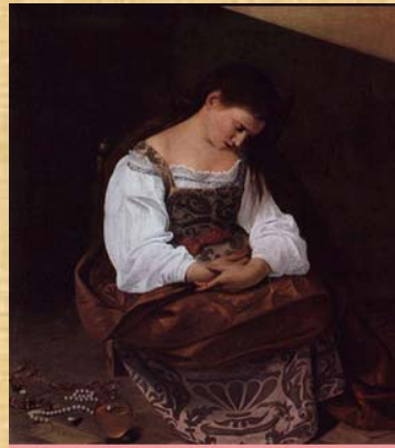
Maddalena Penitente - 1597 Roma

Comandante della guardia portuale ferma il grande Caravaggio e ne ordina l'arresto. La detenzione in condizioni pessime, debilita fortemente Michele che verrà scarcerato ma troppo tardi. Morirà sulla spiaggia di Porto Ercole, senza riuscire a raggiungere Roma, fra le braccia di Costanza Colonna arrivata giusto in tempo per