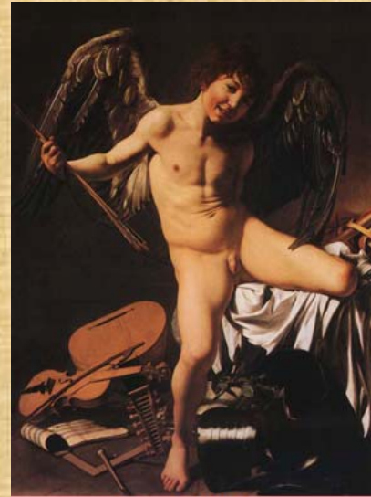
Amore Vincitore - 1601 - Berlino