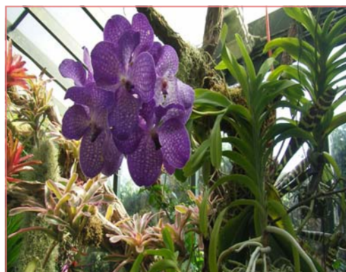
Serra delle orchidee