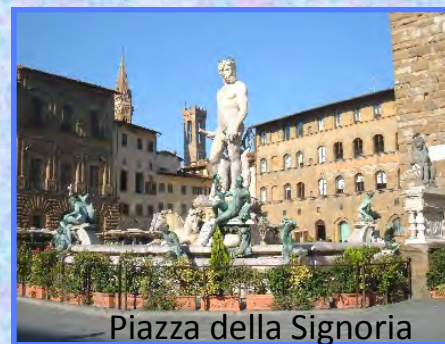
Piazza della Signoria