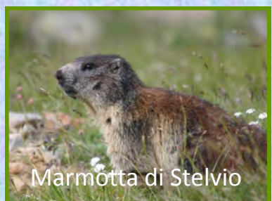
Marmotta di Stelvio